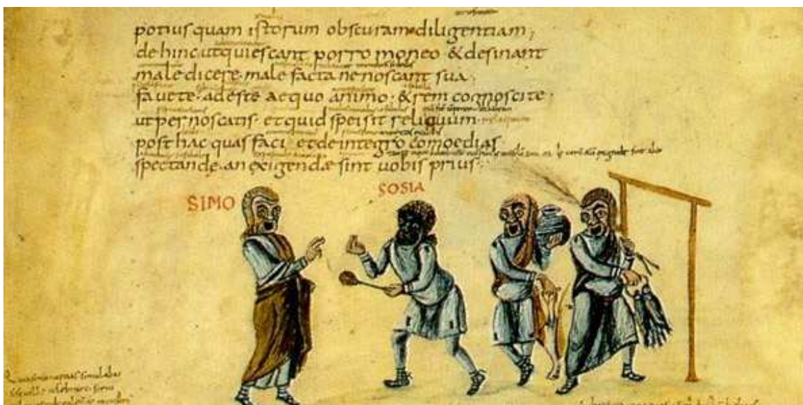
Fragmento de un manuscrito de Terencio escrito en carolina minúscula alrededor del año 825 d.C.

Así, mientras que las victorias militares y los manejos políticos deberían servir para adquirir poder y territorio, la cultura debería mantener la sociedad en unas cotas intelectuales nunca antes alcanzadas.