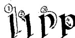
ductus de cuatro movimientos